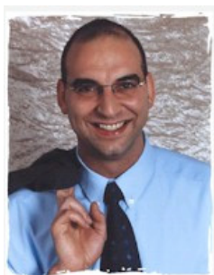
Bürgermeister Klaus Schejna

erzielt. Im letzten Vertragsjahr betrug die Einsparung mit 42.665 EUR rund 12,5 % der Jahresenergie- und Wasserkosten. Auch zukünftig wird die Fortführung des Energiemanagements durch die Verwaltung jährlich eine Entlastung des Haushalts bewirken und gleichzeitig einen Beitrag zum Klimaschutz leisten.